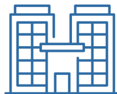
1. Sopralluogo tecnico