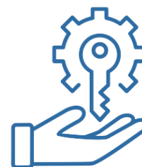
5. Realizzazione intervento chiavi in mano