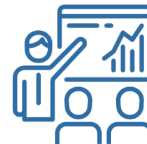
2. Analisi Energetica e diagnosi multidisciplinare