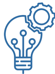
4. Scelta dell'intervento più adeguato