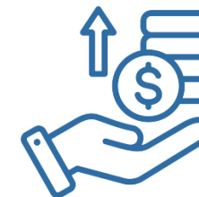
3. Proposta degli interventi fattibili ed analisi costi benefici