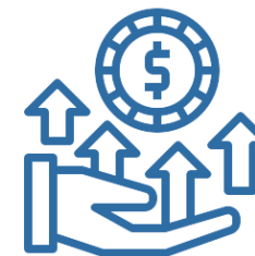
6. Cessione del Credito